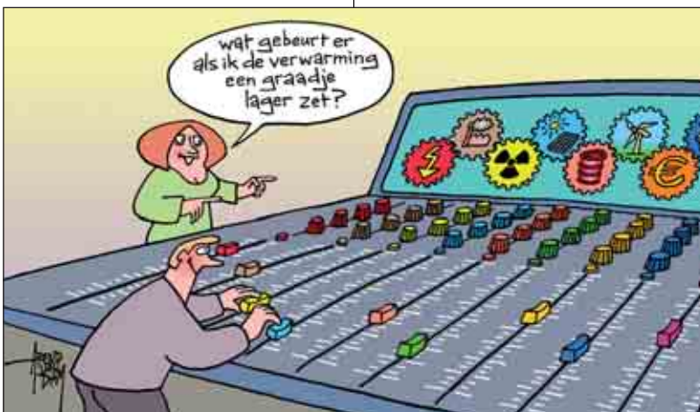
ALLES GRIJPT IN ELKAAR...

*) Waar valt de energietoekomst te modelleren? www.energietransitiemodel.nl voor de Nederlandstalige versie of www.energietransitiemodel.com voor de Engelstalige versie.